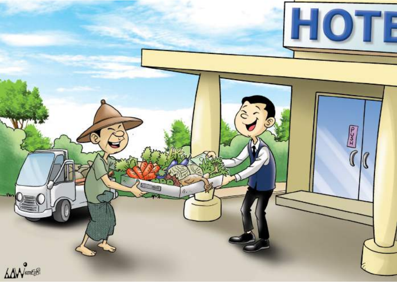
ဒေသခံလယ်သမားများထံမှ ထွက်ကုန်များဝယ်ရန် စဉ်းစားပါ