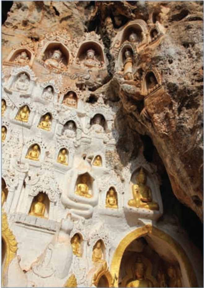
မြန်မာနိုင်ငံတာဝန်သိသော ခရီးသွားလုပ်ငန်းမူဝါဒ၏ရည်ရွယ်ချက်(၉)ရပ်အတွက် အရေးယူဆောင် ရွက်ရန်အချက်စုစုပေါင်း (၅၈)ချက် ကိုခွဲဝေသတ်မှတ်ထားပါသည်။

မြန်မာနိုင်ငံတာဝန်သိသော ခရီးသွားလုပ်ငန်းမူဝါဒကိုအရေးယူဆောင်ရွက်ရမည့် အချက်များဖြင့် အကောင်အထည်ဖော်သွားမည်ဖြစ်ပါသည်။ အဆိုပါအချက်များအား သတင်းအချက်အလက်စုဆောင်းရေးလုပ်ငန်းအဖွဲ့မှအစိုးရ-ပုဂ္ဂလိကကဏ္ဍ အလုပ်ရုံဆွေးနွေးပွဲအတွင်း စိစစ်ထုတ်နုတ်ထားခြင်းဖြစ်ပြီးမူဝါဒရေးဆွဲ၍ အဆို သတ်ည့်လာခံကျင်းပစဉ်အတွင်းဦးစားပေးအစီအစဉ်များကိုသတ်မှတ်ခဲ့ခြင်း ဖြစ်ပါသည်။ အဓိကကျသည့်တာဝန်မှာ အရေးယူဆောင်ရွက်ရမည့်အချက်များအား အကောင်အထည်ပေါ်ဆောင်ရွက်မှုအပေါ် ညှိနှိုင်းဆောင်ရွက်ပေးရန်နှင့်တိုး တက်မှုအားစောင့်ကြည့်ရန်ဖြစ်သည်။ အခြားတာဝန်ရှိသူများအနေနှင့်လည်း အကြံပြုခြင်း၊ ညှိနှိုင်းပေးခြင်း(သို့) အထောက်အကူပြုခြင်းကဏ္ဍများမှ ပါဝင် တာဝန် ယူကြရမည်ဖြစ်ပါသည်။ အရေးယူဆောင်ရွက်ရမည့်အချက်များအား ဦးစားပေးအစီအစဉ် သတ်မှတ်ခြင်းနှင့် ပတ်သက်၍ လုပ်ငန်းရှင်များပူးပေါင်း ပါဝင်မှုများဖြင့် ချမှတ်ထားခြင်း ဖြစ်ပါသည်။ အရေးယူဆောင်ရွက်ရန် အချက်များအားလုံးကို ဦးစားပေးအစီအစဉ်ချမှတ်ထားလင့် ကစားငွေကြေး ကျခံနိုင်မှု၊ လူသားအရင်းအမြစ် စွမ်းဆောင်နိုင်မှုနှင့် လုပ်ငန်းအားစဉ်ဆက်မပြတ် ဆောင်ရွက်နိုင်မှုအခြေအနေ များအရ ဆောင်ရွက်ရန် အချက်များအား အရေးတကြီး/အကောင်အထည်ဖော်နိုင်စွမ်းပေါ်မူတည်၍ အဆင့်မြင့်ဦးစားပေး အဆင့်၊ သာမန်အဆင့်၊ သာမန်အောက်အဆင့်စသည်ဖြင့် ခွဲခြားသတ်မှတ်ထား ပါသည်။