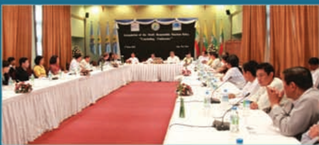
Stakeholders formulating the Responsible Tourism Policy in Nay Pyi Taw.

ဤမြန်မာနိုင်ငံတာဝန်သိသော ခရီးသွားလုပ်ငန်းမူဝါဒနှင့်အတူ ပြည်ထောင်စုသမ္မတမြန်မာနိုင်ငံတော်သည် ခရီးသွားလုပ်ငန်းဖွံ့ဖြိုးရေး၊ စီမံချက်ရေးဆွဲရေး၊ စီမံခန့်ခွဲရေးနှင့်မြှင့်တင်ကြေငြာရေးဆုံးဖြတ်ပြီးဖြစ်ပါသည်။ အထူးသဖြင့်ရေရှည်တည်တံ့ခြင်း၊ အရည်အသွေးမြည့်မီခြင်း၊ ယှဉ်ပြိုင်အနိုင်ရရှိခြင်း၊ ယဉ်ကျေးမှုဆိုင်ရာတာဝန်များနှင့် လူမှုရေးရာဇဝတ်မှုများကိုအသိအမှတ်ပြုခြင်း၊ သဘာဝဝန်းကျင်ရေရှည်တည်တံ့အောင် ထိန်းသိမ်းခြင်းနှင့်စီးပွားရေး အလားအလာကောင်းခြင်းများအပေါ် အလေးထား ဆောင်ရွက်ပါမည်။ အလားအလာကောင်းပြီး ရေရှည်တည်တံ့သောခရီးသွားလုပ်ငန်းအားမြန်မာနိုင်ငံတွင်ဖော်ဆောင်ရန်အစိုးရကဏ္ဍနှင့် ပုဂ္ဂလိကကဏ္ဍတို့၏ပူးပေါင်းပါဝင်မှုလိုအပ်ပါသည်။ တပြိုင်တည်းမှာပင် ဒေသအတွင်းရှိ လူမှုအဖွဲ့အစည်းများနှင့်ပြည်သူလူထုအသင်းအဖွဲ့များ၏ပါဝင်မှုနှင့် ထောက်ပံ့အားပေးမှုများလည်းလိုအပ်ပါသည်။ ပုဂ္ဂလိကအပိုင်း၏အခန်းကဏ္ဍမှာ ခရီးသွားလုပ်ငန်း၏ ဝန်ဆောင်မှုနှင့်အတွေ့အကြုံများဖွံ့ဖြိုးစေရေးနှင့်အရင်းအနှီးများ တိုးတက်များပြားလာစေရေး၊ တွန်းအား ပေးဆောင်ရွက်ရန်ဖြစ်ပါသည်။ အစိုးရ၏အခန်းကဏ္ဍအနေဖြင့်အခြေခံအဆောက်အအုံများတည်ဆောက်ရေးနှင့် တိုးတက်လာစေရေးဆောင်ရွက်ရန်နှင့်တပြိုင်တည်းမှာ ပင်ရင်းနှီးမြုပ်နှံမှု အခြေအနေ၊ အခွင့်အလမ်းကောင်းများပေါ်ထွန်းစေပြီး အထောက်အကူပြုရန် ဖြစ်ပါသည်။ ခရီးသွားလုပ်ငန်းကဏ္ဍကြီးအတွင်းစီမံ ကိန်းများရေးဆွဲချမှတ်ခြင်း၊ ဆုံးဖြတ်ချက်ချ မှတ်ခြင်းဆိုင်ရာလုပ်ငန်းစဉ်များနှင့်