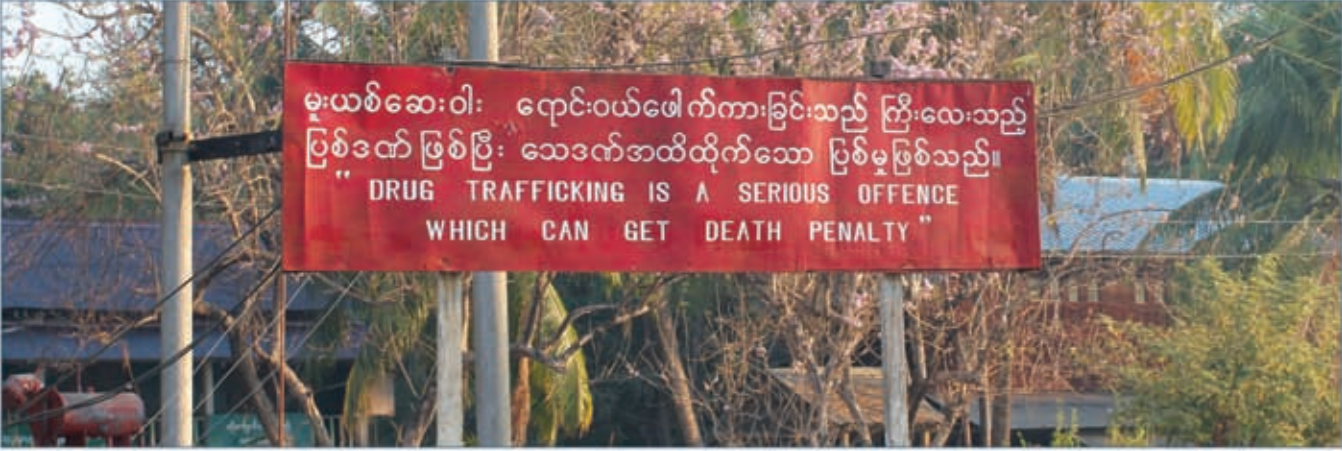
မြန်မာနိုင်ငံတာဝန်သိသောခရီးသွားလုပ်ငန်းပူဝါဒ