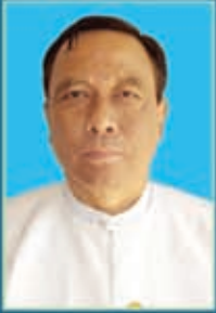
ဦးဌေးအောင် ပြည်ထောင်စုဝန်ကြီး ဟိုတယ်နှင့်ခရီးသွားလာရေးလုပ်ငန်း ပြည်ထောင်စုသမ္မတမြန်မာနိုင်ငံတော်

ကျွန်ုပ်တို့သည် ခရီးသွားလုပ်ငန်းဖြင့် မြန်မာနိုင်ငံအား နေထိုင်ရန် ပိုမိုကောင်းမွန်သော နေရာတစ်ခုဖြစ်စေရန်ရည်ရွယ်ပြီး အလုပ်အကိုင် ပိုမိုဖန်တီးရေး၊ ကောင်းမွန်၍ ကြီးမားသောစီးပွားရေး အခွင့်အလမ်းကောင်းများရရှိစေရေး၊ သဘာဝသယံဇာတများနှင့် ယဉ်ကျေးမှုအမွေအနှစ်များ ထိန်းသိမ်းစောင့်ရှောက်ရေး၊ ကြွယ်ဝ၍ ကွဲပြားသောယဉ်ကျေးမှုကို မျှဝေစားစေရေးတို့အတွက် တာဝန်သိသောခရီးသွားလုပ်ငန်းအားဖြင့် ပံ့ပိုးပေးရမည်ဖြစ်ပါသည်။ ကျွန်ုပ်တို့၏ယဉ်ကျေးမှု၊ နေထိုင်မှုဘဝပုံစံကိုသာယာကြည်နူးခံစားပြီး အလေးထားလည်ပတ်ကြသော ဧည့်သည်များကို နွေးထွေးစွာကြိုဆိုပါသည်။